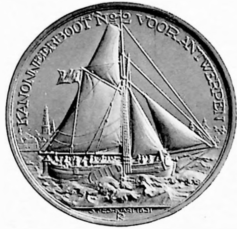
J. C. J. VAN SPEYK 1831—1931 1e Penning 1931 Ontwerp Jac. J. van Goor.