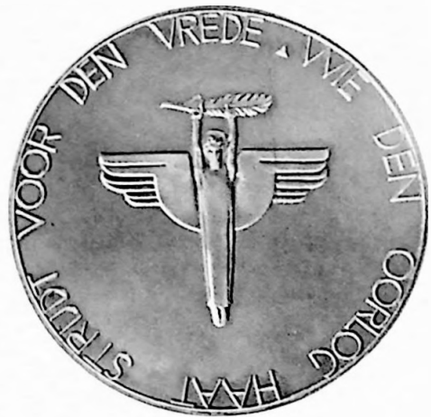
VREDE 2e Penning 1931 Ontwerp D. Bus.