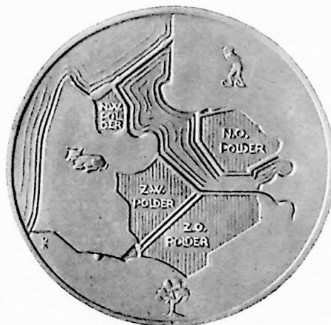
2e Penning Vereenigingsjaar 1930.