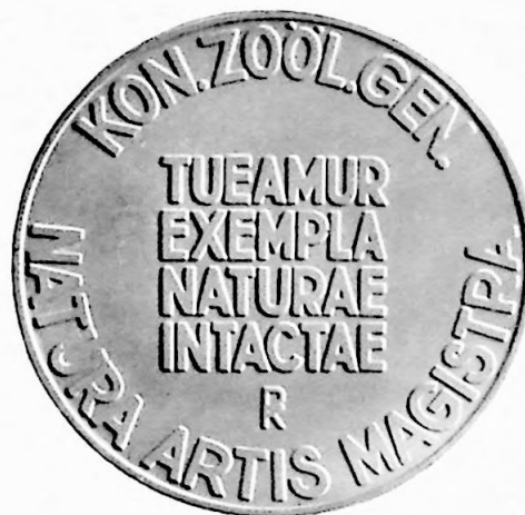
1e Penning Vereenigingsjaar 1930.