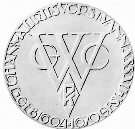
2e Penning Vereenigingsjaar 1929.