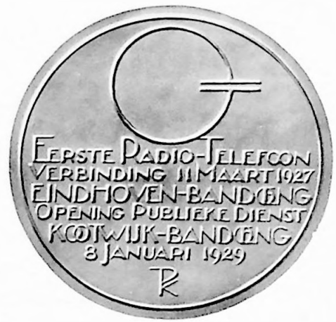
1e Penning Vereenigingsjaar 1929.