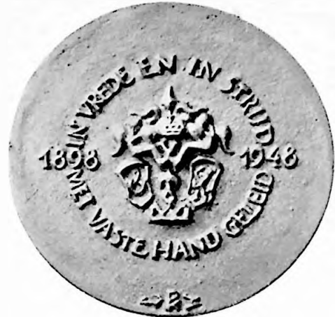
1c PENNING 1948 50 JARIG REGERINGSJUBILEUM VAN H.M. KONINGIN WILHELMINA ONTW. MEVR. L. E. J. VAN LUIJN-METZ