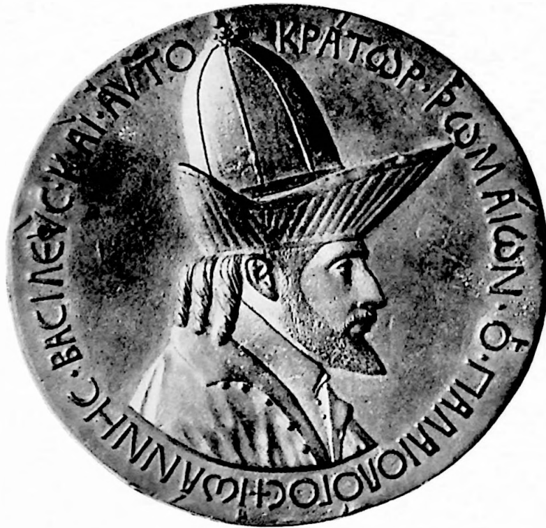
1438 Pisanello. Keizer Johannes Paleologus