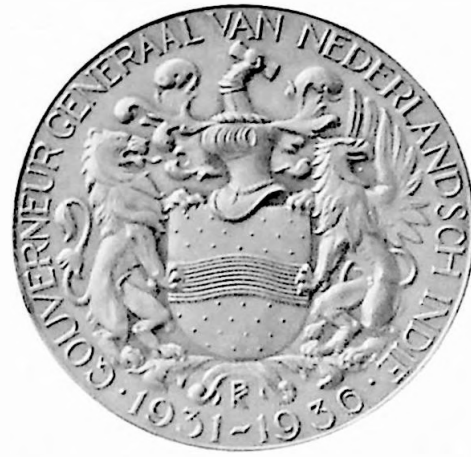
1e Penning 1937 Ontw.: Prof. O. Wenckebach