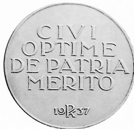
2e Penning 1937 Ontw.: Toon Dupuis †