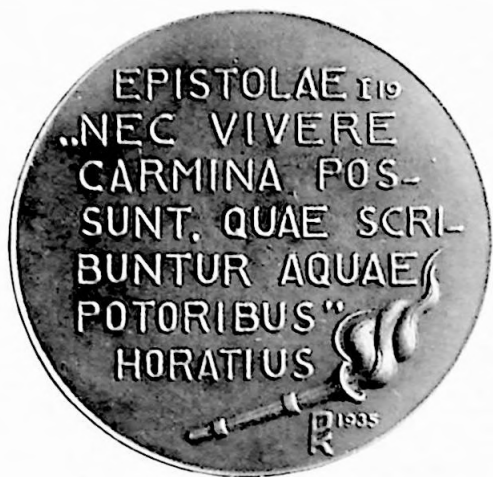
2e Penning Vereenigingsjaar 1935.