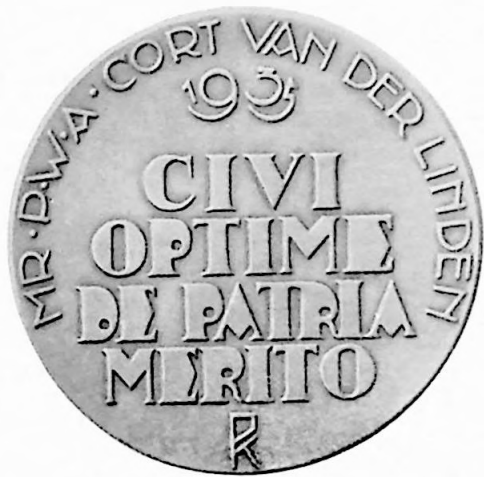
1e Penning Vereenigingsjaar 1935.