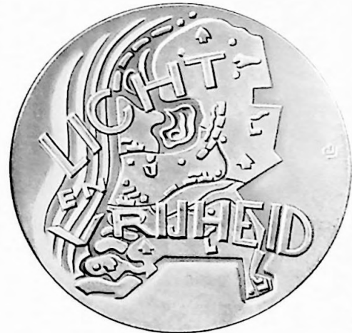
Penning van het Algemeen Handelsblad.