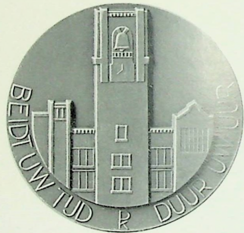
2e Penning Vereenigingsjaar 1934.