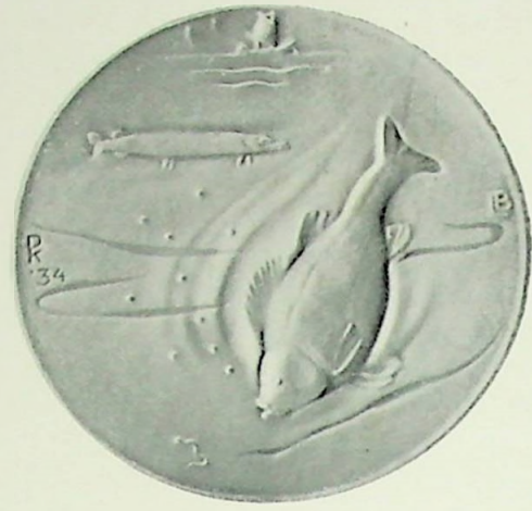
1e Penning Vereenigingsjaar 1934.