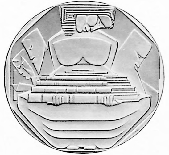
Penning van de Federatie van Boekdrukkers.