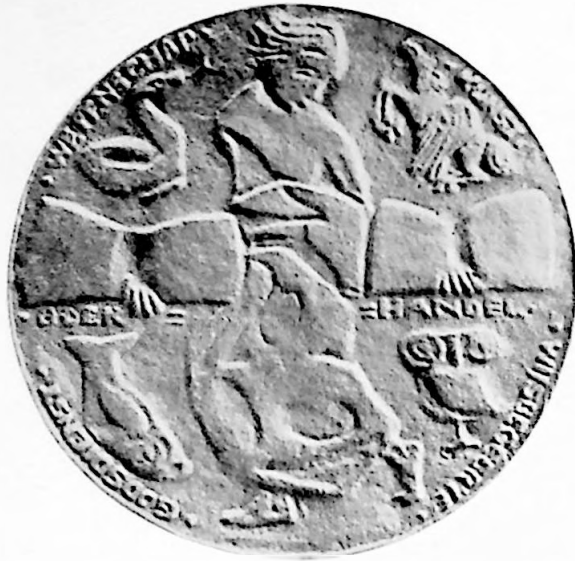
Penning van de Vereeniging ter bevordering van de Belangen des Boekhandels.