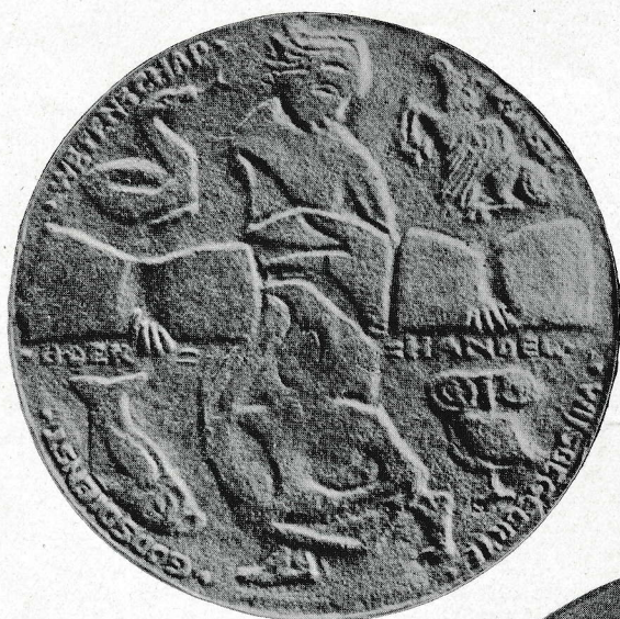
PENNING V. D. VER. TER BEVORD.