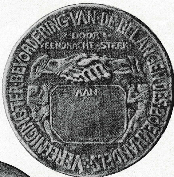
V. D. BELANGEN DES BOEKHANDELS