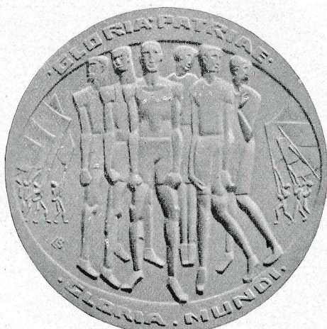
OLYMPISCHE SPELEN 1928