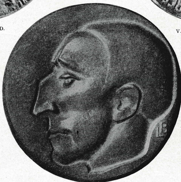
PORTRETPENNING Modelé L. BOLLE