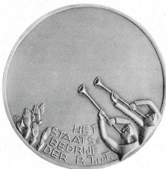
PENNING STAATSBEDRIJF DER P. T. T. Modelé L. BOLLE