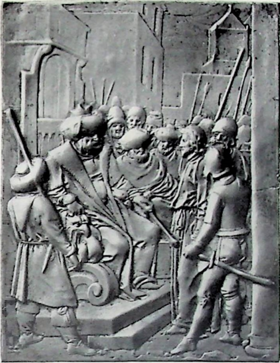
E Jezus voor Pilatus.