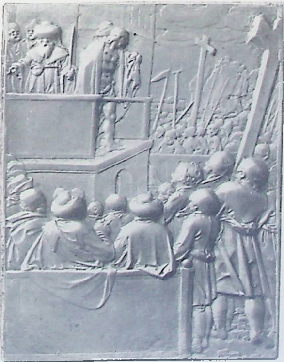
G Ecce Homo.