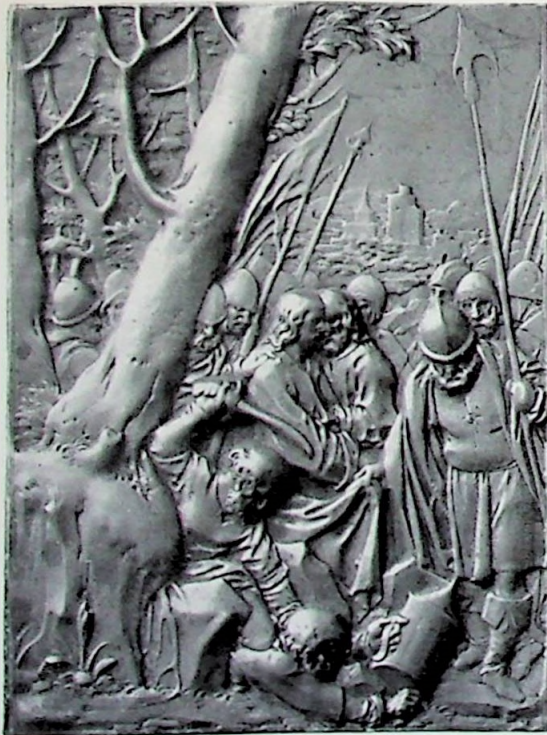
C De gevangenneming van Jezus.