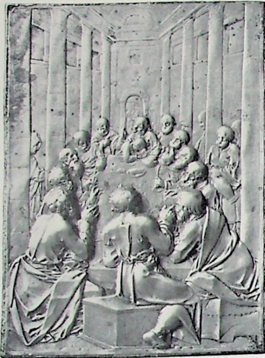
A Het avondmaal.