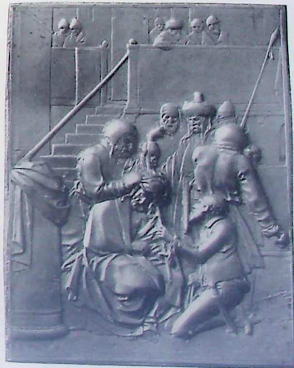
H De bespotting van Jezus.