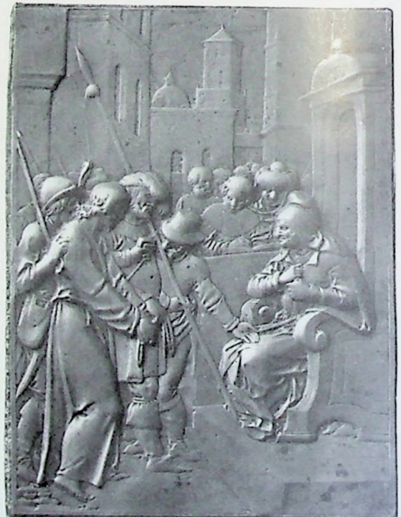
D Jezus voor den Priester.