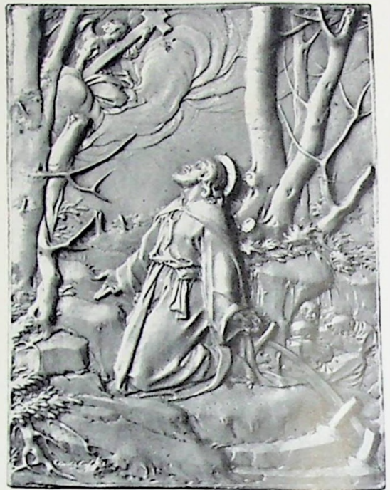
B Jezus in den tuin van Gethsemané.