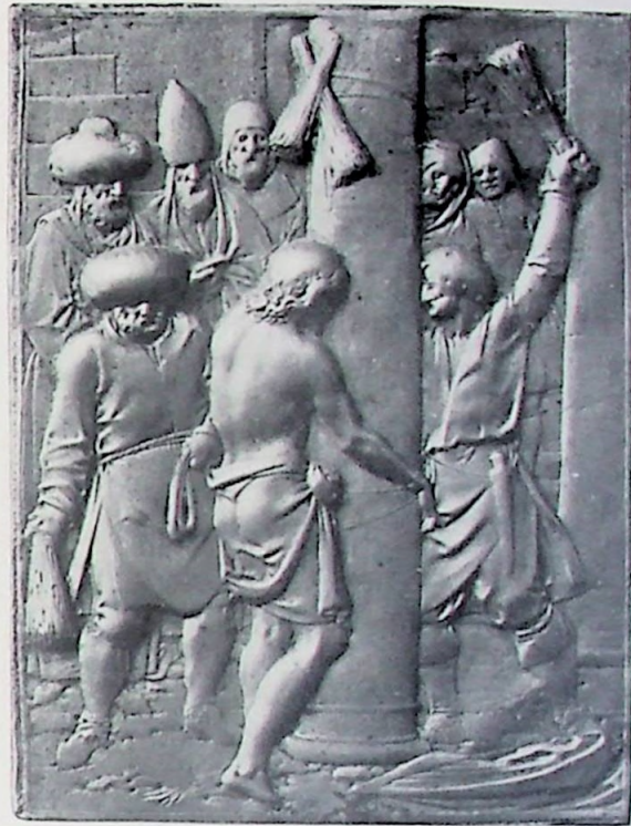
F De zeeseling.